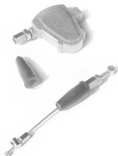
L10021 wspomaganie sprzęgła 89 zł