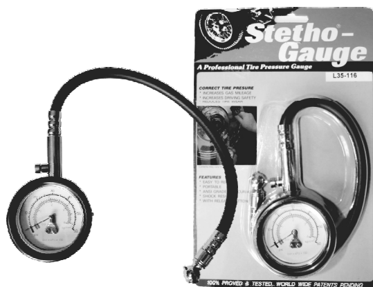
L35116 miernik ciśnienia 59,50 zł