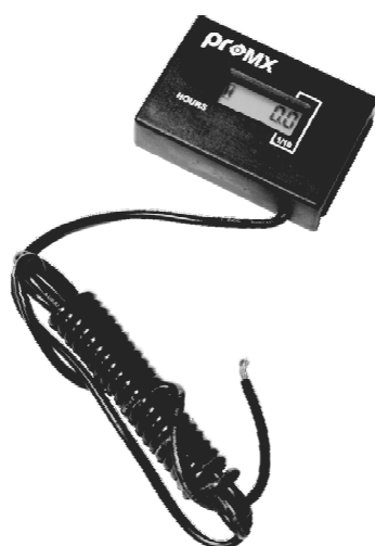
PR01 licznik motogodzin 139 zł