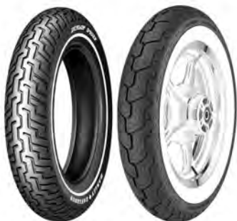
ciemni biały bok szeroki biały bok